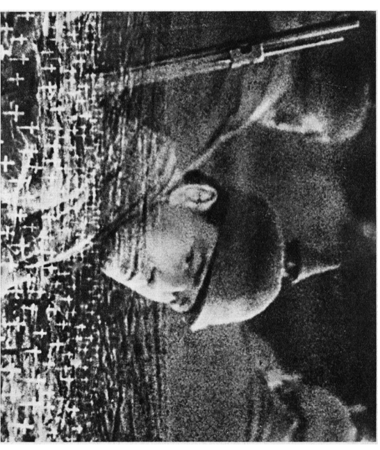
Standbild aus dem Film „Im Westen nichts Neues“

Den Abschluß der Reihe bildet eine Veranstaltung zum Thema Kriegsfotografie. Viele Kriegsfotografen sind zu Ikonen geworden und prägen das Bild bestimmter Konflikte über Generationen. Anhand historischer und aktueller Beispiele soll die Rolle von Fotografen in Kriegssituationen diskutiert werden. Wann ist ein Foto ein neutrales Dokument? Wie werden Fotos für propagandistische Zwecke mißbraucht? Gibt es Stereotypen, die immer wieder bedient werden?